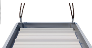
Système de manutention par chaîne